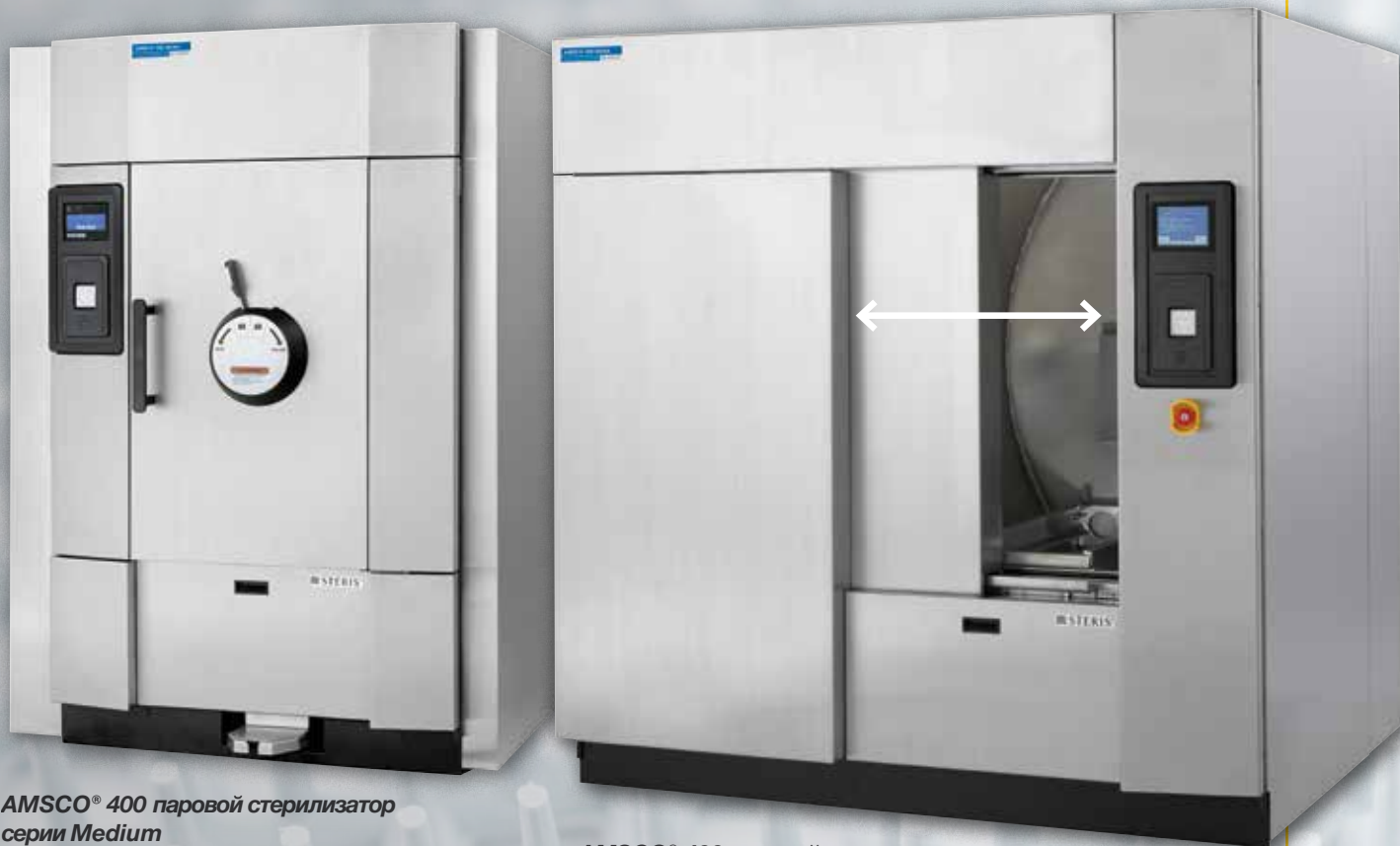
AMSCO® 400 паровой стерилизатор серии Medium с ручным открыванием распашной двери 26" x 37.5" (660 x 950 мм)